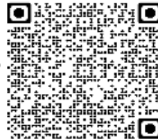
Tiêu chuẩn tối thiểu